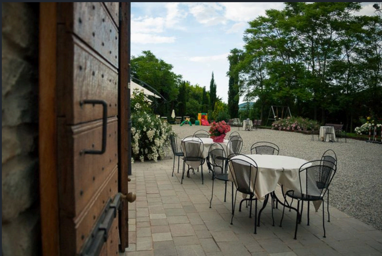
La gioia dei sapori, degli odori, della brezza leggera, dell'armonia delle colline