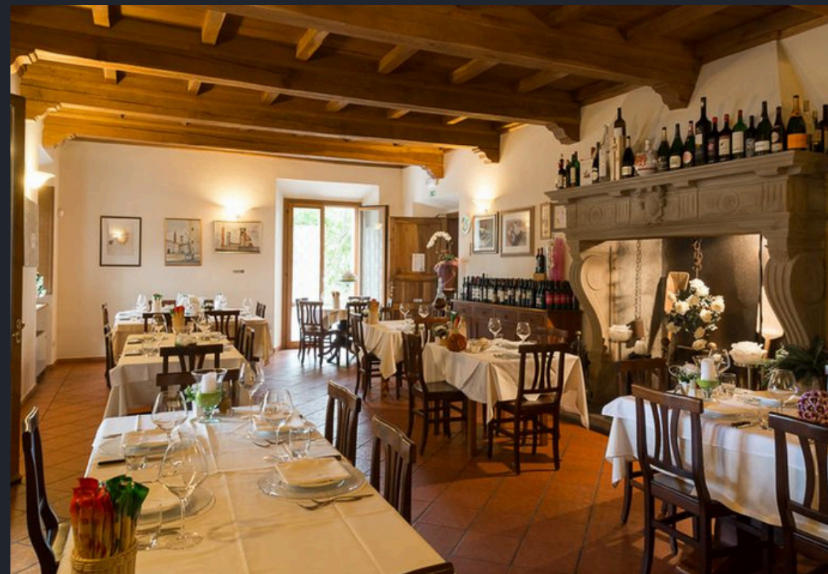
La calda atmosfera di un antico camino, il vino dei desideri, i piatti che lasciano sapori indelebili